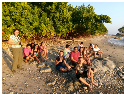
Ekologigruppen Pumornas campamento i St. Miguel

Även ekologigruppen hade miljödagar i mars 2018 med ett marint tema. Målet var att lära sig mer om ett hållbart fiske där de själva fick agera fiskare och se konsekvenserna om de fiskar för mycket.