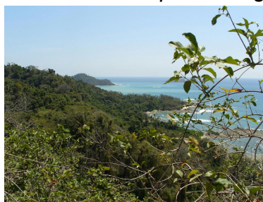
Bild från ett 30 m högt vattenfall i Karen Mogensen Reservatet till vänster, samt från utkiksplatsen ovan St. Miguel i Cabo Blanco till höger.