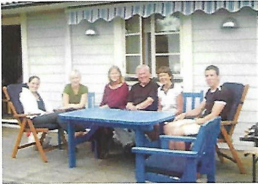
Laura (t.v.) med entourage på Gotland

in the same way on the environmental care. Although Costa Rica is a country with so many natural resources, many people still do not understand the importance of the conservation of the environment. I feel that I have the obligation to teach to my people that in spite of being a developing country we can protect our resources by several ways one simple things is to separate the garbage in the houses and the offices.