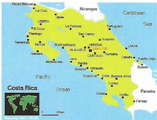
Karta över Costa Rica