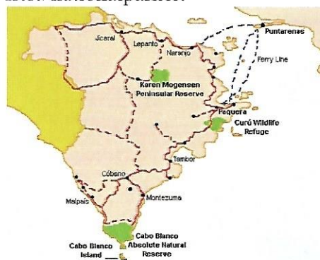
Karta över Nicoyahalvön och Cabo Blanco

År 1995, då vi startade vår miljöutbildning i skolorna runt Cabo Blanco, trodde inte många att ökad miljökunskap skulle bli ett av de viktigaste redskapen för att skydda värdefull skog. Nu 12 år senare har man börjat anställa miljökoordinatörer i flera nationalparker.