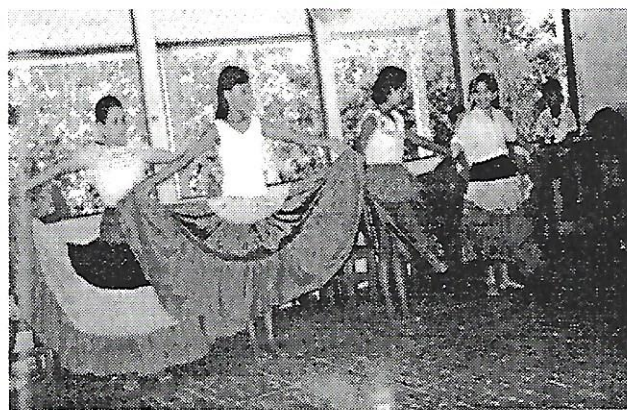
Dansuppvissning i Montezúmaskolan