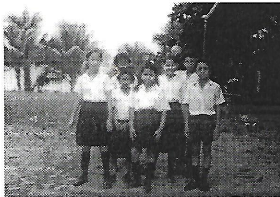
Fotbollsplanen utanför skolan i byn Mal País, kantad av palmer och ett horisontlöst Stilla havet.